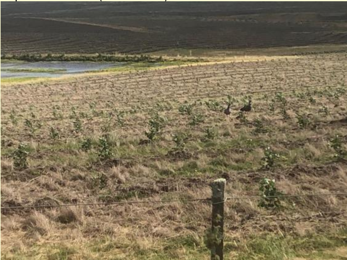
Casal de Chajá ( Chauna torquata ) dentro de plantación forestal