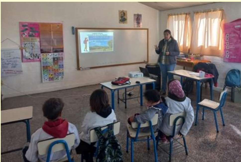
Escuela N° 77 Tapes Grande, Lavalleja.