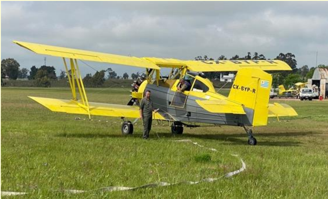
Aviones y depósitos de agua apostados para combate de incendios

Dentro de las comunicaciones a diario con vecinos y comunidades, se registran aquellas de mayor relevancia o que requieren algún grado de gestión por parte de la empresa. Así también, se registran los reclamos o quejas, para darles respuesta oportuna y seguimiento.