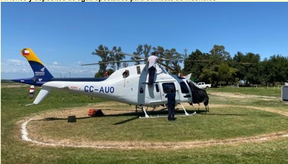
Helicópteros en las 3 bases con brigadas helitransportadas apostadas