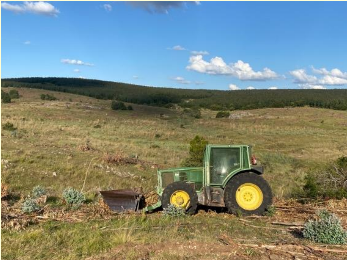
Actividades de preparaciones de suelo para reforestación

Durante el 2021 y el primer semestre del 2022 se realizaron un total de 129 auditorías a operaciones, obteniéndose un cumplimiento promedio total de 96%.