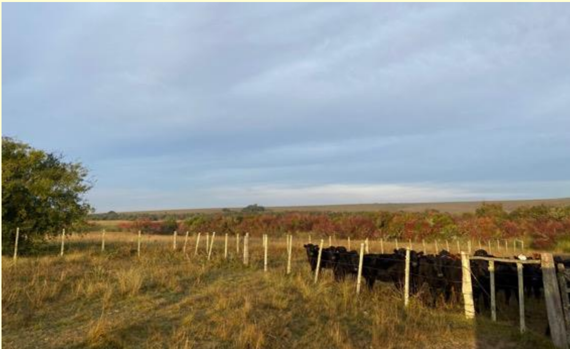
Ganado de pastoreantes en campos de Terraligna

Todos los establecimientos se encuentran bajo la modalidad silvopastoril, dando preferencia de la ocupación de los pastoreos a vecinos y productores de las zonas aledañas. Esto constituye uno de los principales canales de comunicación con vecinos, aportando además con una actividad productiva para ellos.