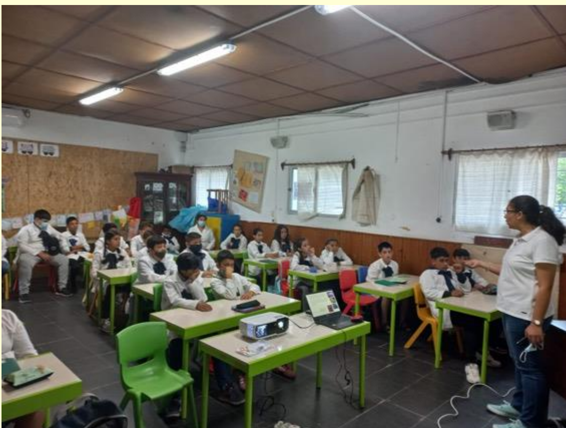
Escuela Nº 68 Cerro Chato, Durazno