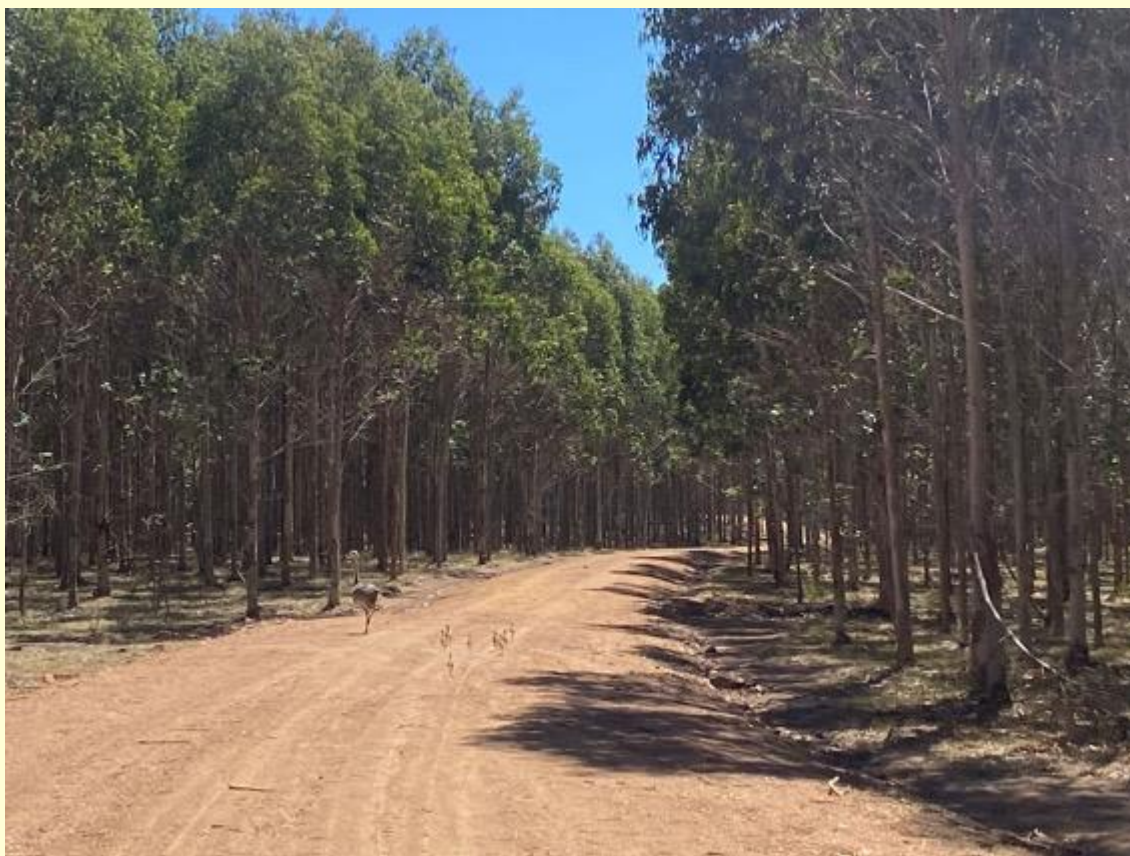
Población de Ñandú ( Rhea americana ) dentro del área productiva forestal