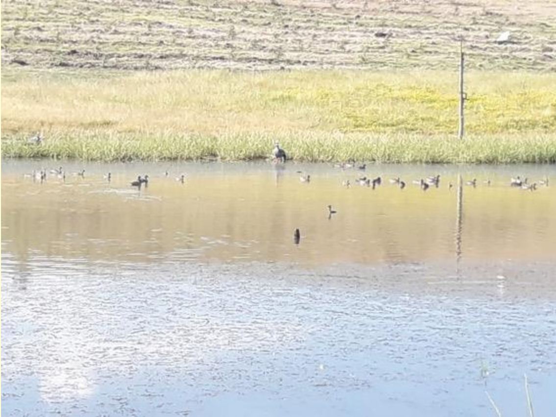
Grupo de Patos Barcinos ( Anas flavirostris )