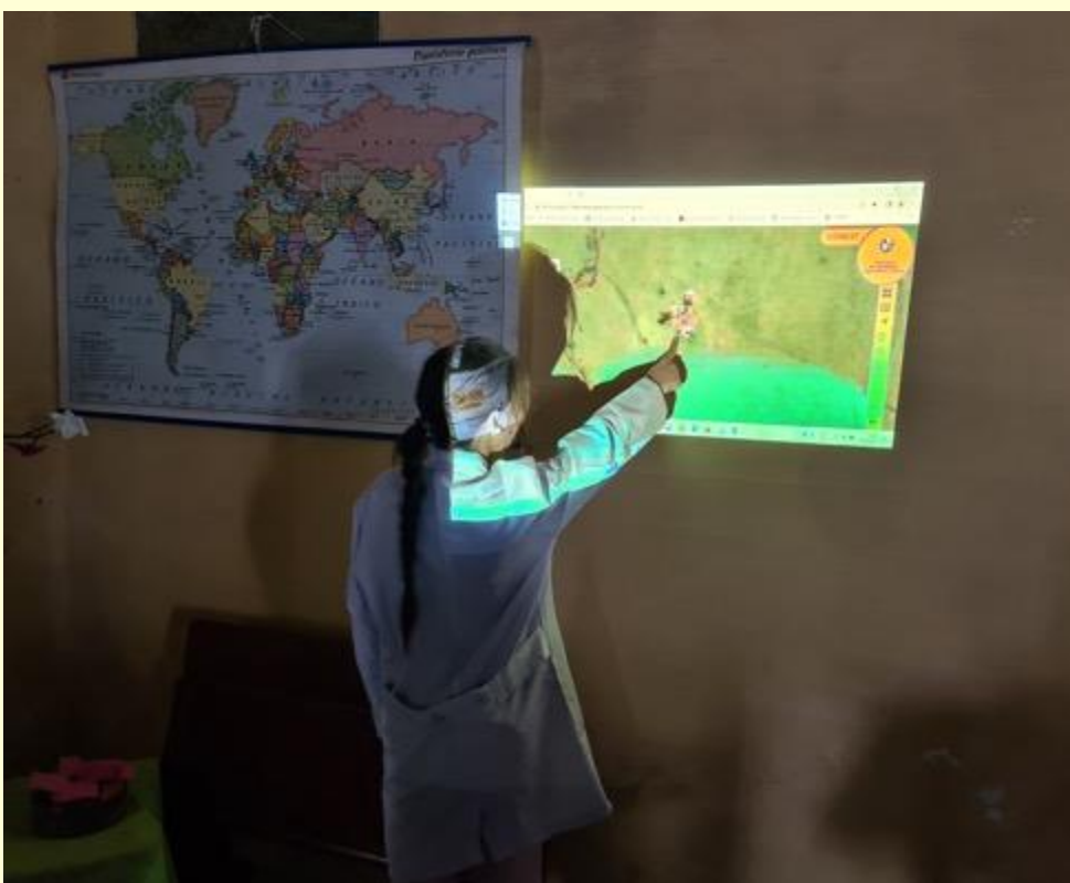
Escuela N° 40 Cuchilla de Juan Gómez, Lavalleja