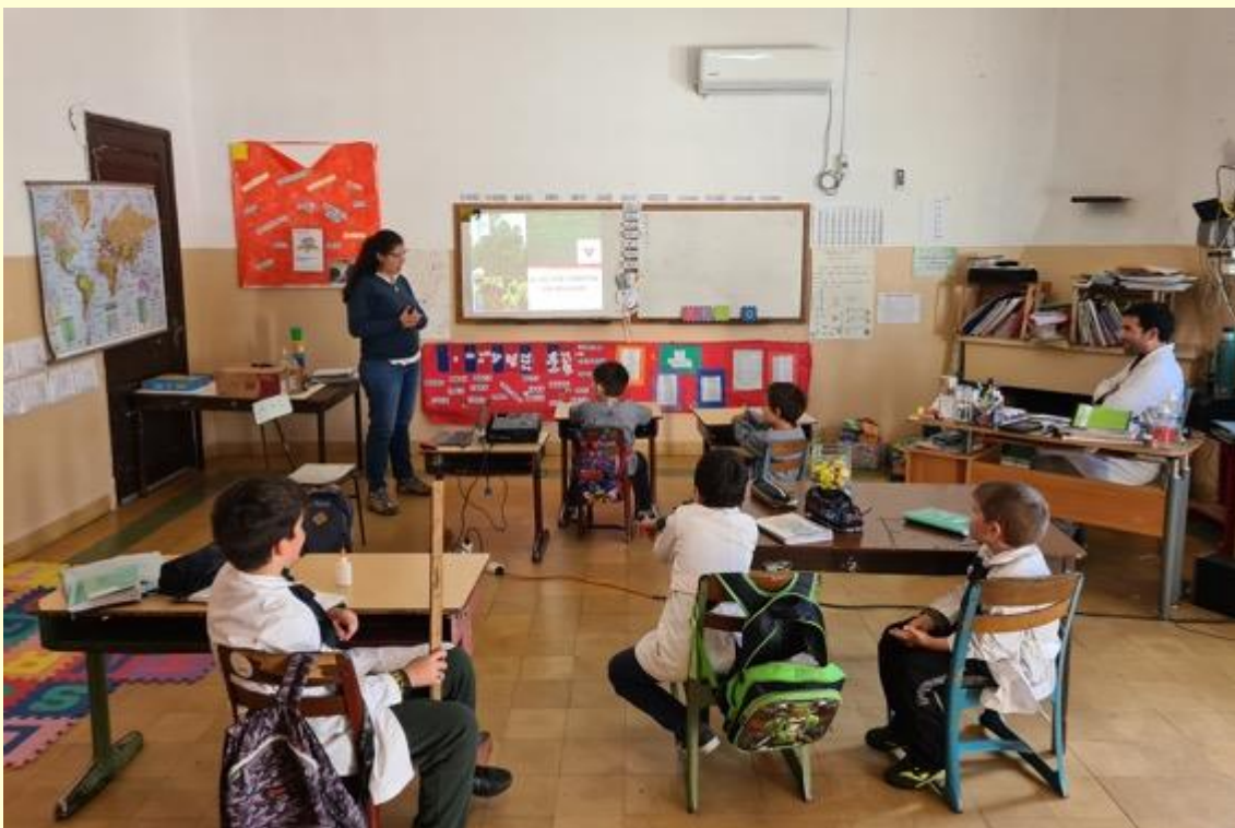
Escuela Nº 20, Illescas, Florida